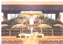
●中ホール(250名様収容)

もしもの時に備えてのお見積りや、仏事(ご法事)などの各種手配等も承っております。 また、お電話等頂きましたら会館内をスタッフがご案内させていただきます。